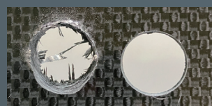
一般的なドリル FRP樹脂ビット

インパクトドライバーにワンタッチで取り付け可能な六角軸シャンクです。電気ドリルやドリルドライバーに対しても滑らず確実なチャッキングができます。