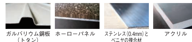
ガルバリウム鋼板 (トタン) ホーローパネル ステンレス (0.4mm) とベニヤの複合材 アクリル